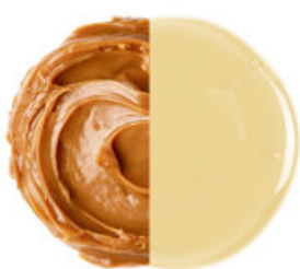
Ovesný a karamelový