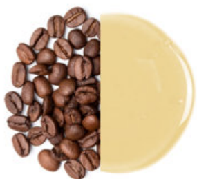
Ovesný a kávový