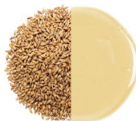
Ovesný a sladový