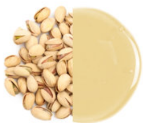
Ovesný a pistáciový