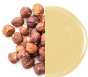
Ovesný a lískový ořech