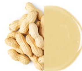
Ovesný a arašídový