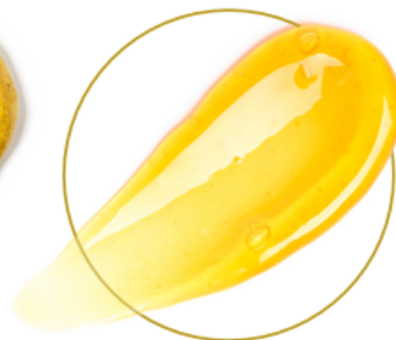
Ovocné a rostlinné koncentráty