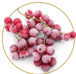
Mražené ovoce a zelenina