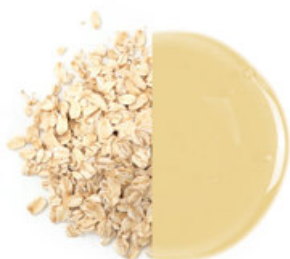
Ovesný koncentrát s nízkým obsahem dextrózy