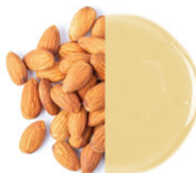
Ovesný a mandlový