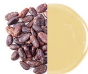
Ovesný a kakaový