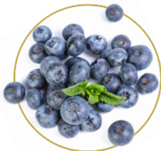
Čerstvé ovoce a zelenina